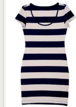
VESTIDO DE RAYAS DE MANGA CORTA